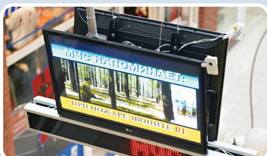
Пункт информирования и оповещения населения в зданиях с массовым пребыванием людей