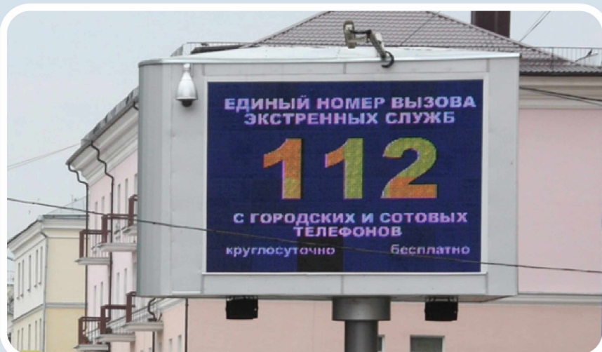
Пункт уличного информирования и оповещения населения