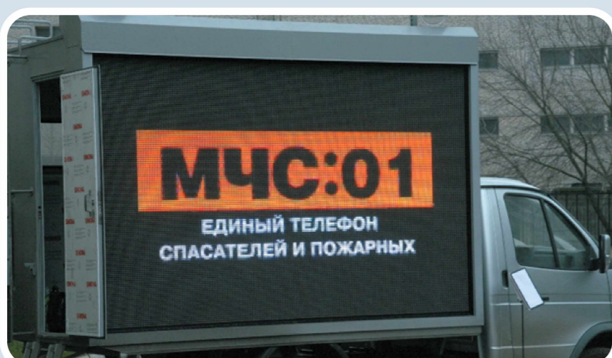
Мобильный комплекс информирования и оповещения населения