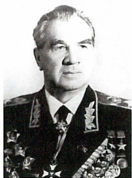
Маршал Советского Союза Чуйков В.И. Начальник гражданской обороны СССР с 1961 г. по 1972 г.

Рост разрушительной силы ракетно-ядерного оружия и неограниченные по дальности возможности его доставки к целям вызвали необходимость создания системы, которая бы обеспечивала надёжную защиту населения и народного хозяйства от оружия массового поражения в масштабе всей страны.