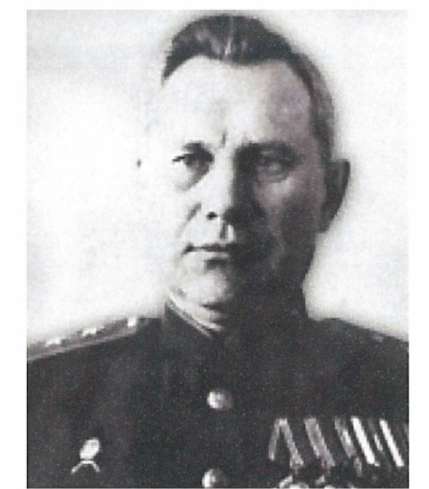
Генерал-лейтенант Королёв М.Ф. Начальник МПВО г. Москвы с августа 1942 г. до конца войны

За годы войны на тыловые объекты страны совершено 659 445 вражеских самолётовывлетов, в ходе которых сброшено около 600 тысяч фугасных и около 1 миллиона зажигательных авиабомб .